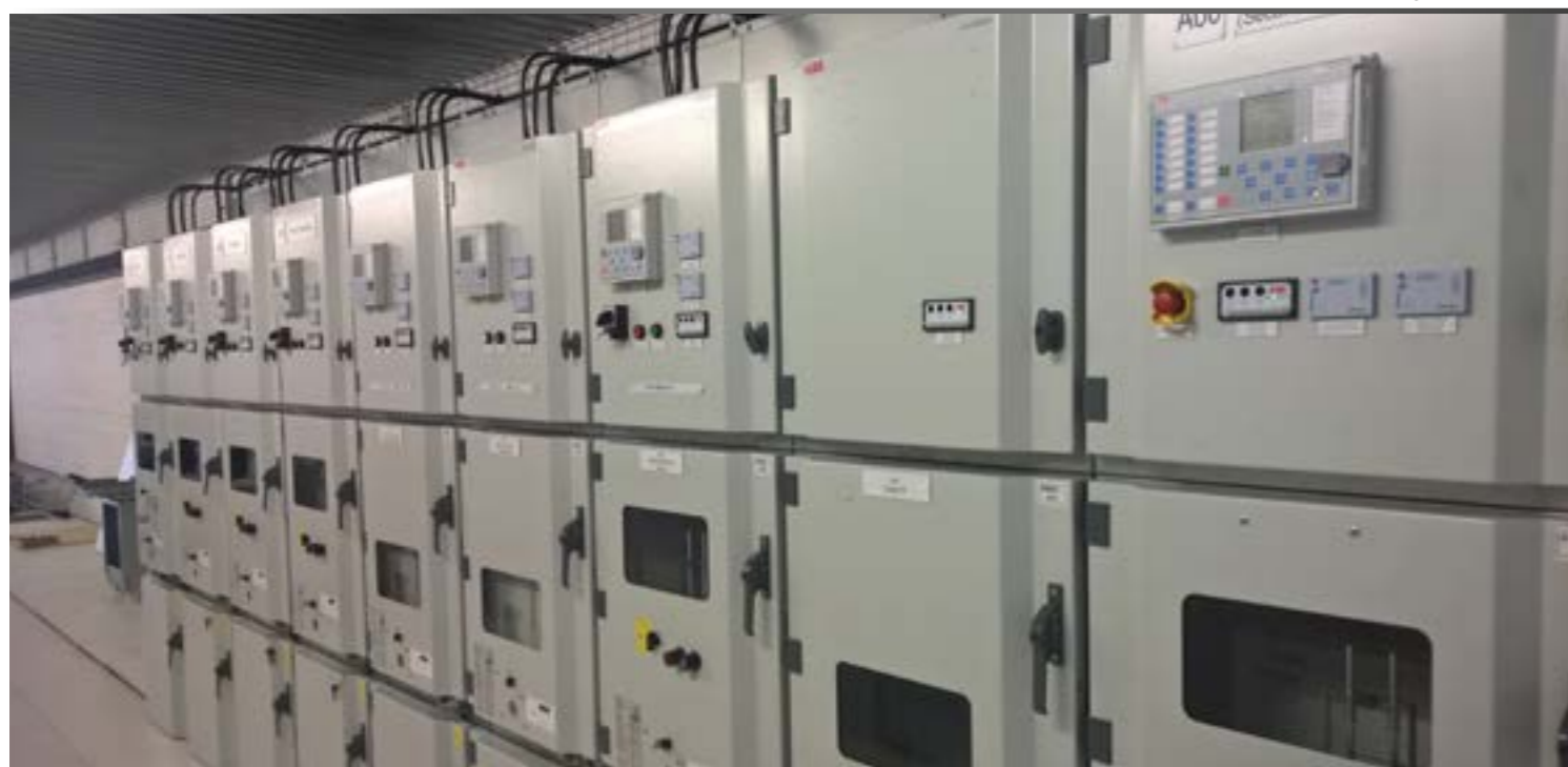
Les « nouvelles cellules », après travaux.