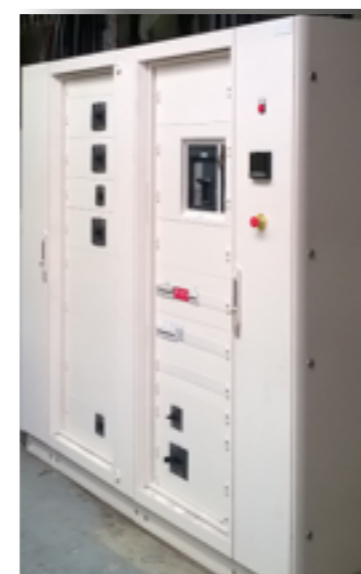
À gauche, vue sur le TGBT après rénovation