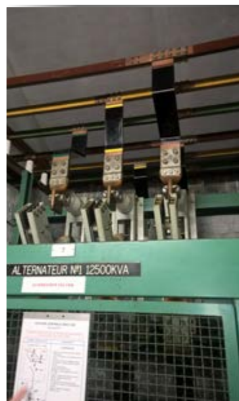
Vue des « anciennes cellules ».